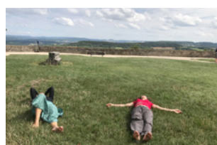
- cours de Tai Chi avec les chênes & repos bien mérité à Vezelay.