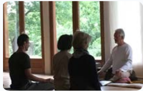
Cours de Tai Chi en extérieur & cours de Chi en salle