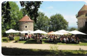
Repas en extérieur par beau temps