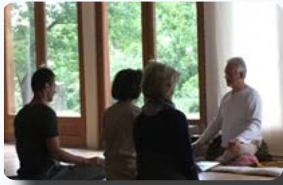
Cours de Tai Chi en extérieur & cours de Chi en salle